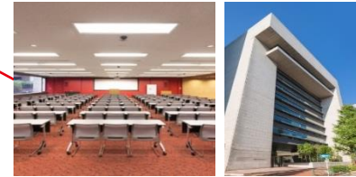
日本橋ライフサイエンスハブ