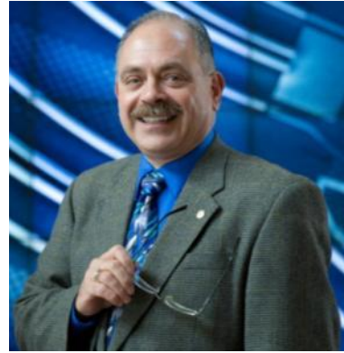
UC サンディエゴ アルバート・ピサノ工学部長