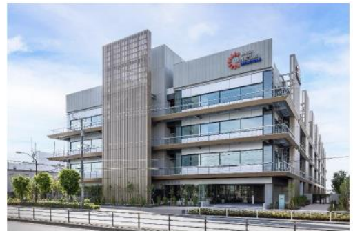
「三井リンクラボ新木場 2」外観

アクセス:東京メトロ有楽町線・東京臨海高速鉄道りんかい線 JR 京葉線「新木場」駅 徒歩 7 分