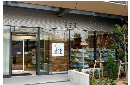
「三井リンクラボ LINK Stock」外観