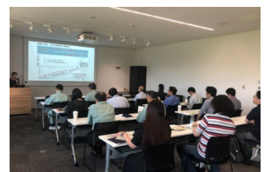
入居者向け講習会の様子(2023年7月)

本サービスでは、「三井リンクラボ」が日本医師会認定産業医(労働衛生コンサルタント有資格者)を入居者へご紹介し、薬品を取り扱うなどラボで有害業務を行う“ライフサイエンス企業”ならではの義務(特殊健康診断・作業環境測